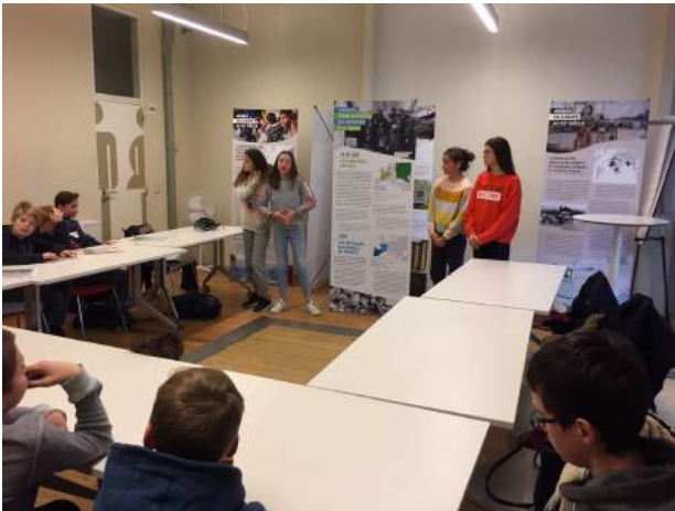
Présentation des élèves lors de l'atelier consacré aux migrations après la discussion.

Enfin, toutes nos activités sont recensées sur le site d'Annoncer la Couleur et sur Enseignement.be.