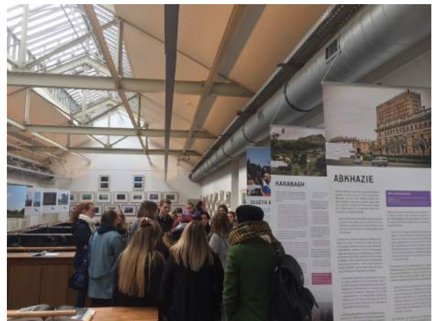
Visite guidée de l'exposition "L'Europe des zones grises" avec une école bruxelloise.