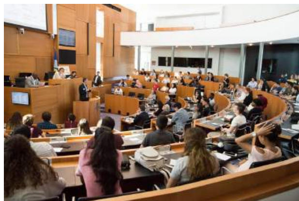
Conférence débat organisée le 9 mai 2018 au Parlement bruxellois et suite à laquelle l'exposition "Migrations, une histoire européenne" fut présentée.

Créées pour l'itinérance, les expositions pédagogiques réalisées par Géopolis sont mises à disposition des écoles, ou toute structure désireuse, pour une somme de 300 € sur Bruxelles (et 300 € + frais de transports hors Bruxelles). Facilement modulables, et autoportées, les expositions sont installées et désinstallées par l'équipe de Géopolis qui se charge de la mise en scène si nécessaire. Il est également envisageable, sur demande, qu'un membre de l'équipe vienne animer un atelier sur place. Nos expositions ont déjà circulé dans de nombreuses écoles bruxelloises (dont Fransisco Ferrer, 3 écoles d'Anderlecht...), au Parlement bruxellois, dans un bâtiment de la Commission européenne.