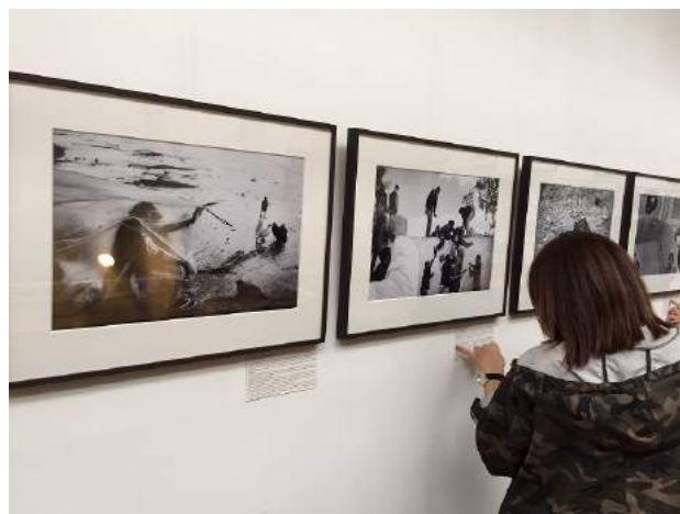
Visite de l'Institut Diderot lors de l'exposition "Migrations, une histoire européenne".